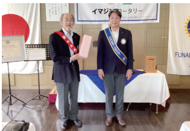
遠田会員 ご婦人誕生日