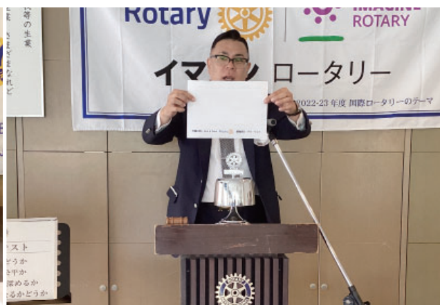
「船橋市平和の集い」について 三須会長エレクト